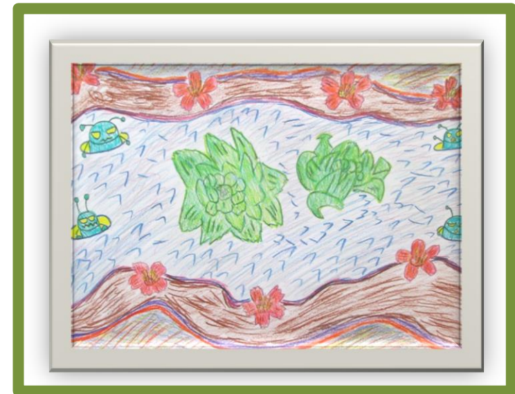
お伊勢の森の絵画作品 katsunoriの作品 「春はごんまり」

今月もごんまりとですが開催いたしました。体操すると贅肉がついたのがわかるねーと話しながら、笑顔で行いました。普段まったく運動しない方でも無理せず行える体操をしていますので皆さんどうぞ!