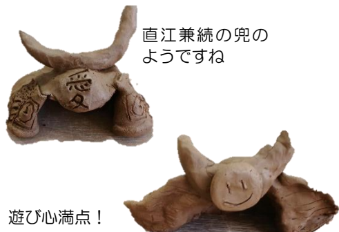
直江兼続の兜のようですね

5/5の子どもの日にちなんで兜を作りました。兜は生まれてきた子どもの将来をお祝いする意味があり、端午の節句を象徴するものです。兜の正面の様子は皆さんアレンジをされており、ニコちゃんマークや文字を入れた方もいました。