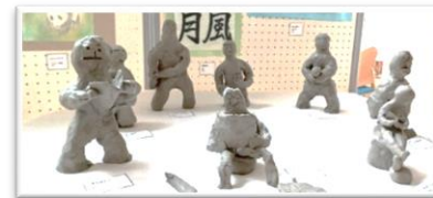
「〇〇の秋」をテーマとした粘土作品

お伊勢の森のある市民総合センターロビーにてメンバーの作品を展示しました。多くの方に見てもらうことができとても嬉しく思います。現在作品の一部をお伊勢の森入口横の壁に展示しています。